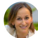
Teresa Boronat Experience Consulting

Casos de éxito de cómo poner las personas en el centro de la ecuación. Desde cómo convertir a los empleados en embajadores a cómo crear una estrategia para que los clientes o usuarios sean los protagonistas y beneficiarios reales de la actividad de una empresa.