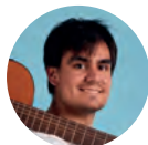
Pau de Ponts Artista, cantautor y presentador