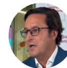
Gaby Masfurroll Clínicas Mi